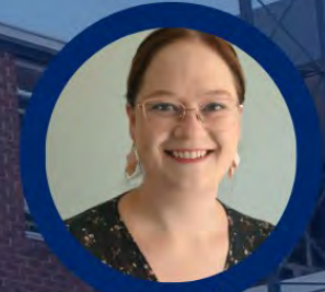
Me. Hanlica Erasmus Fisiese Wetenskappe